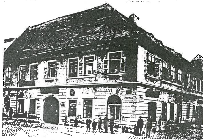
Knoblochs Weinhandlung und Bierstube.